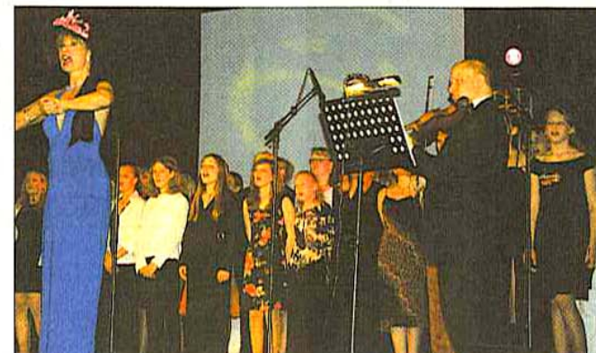
Der IGE-Chor begleitete die Künstlerin nach Ascot.